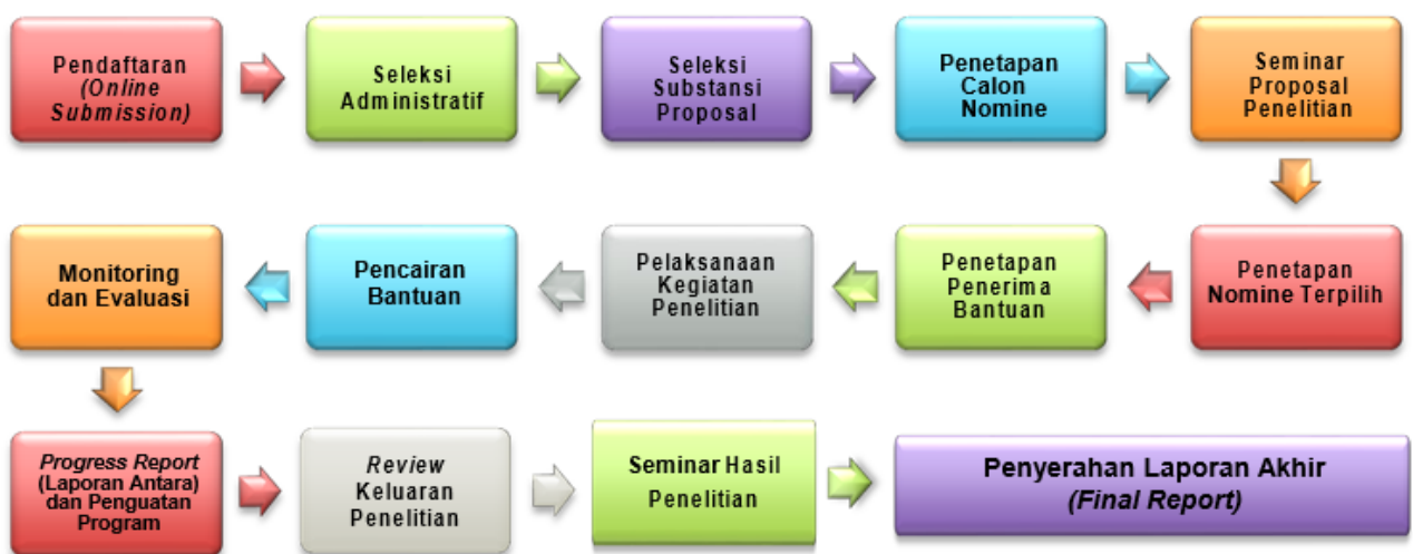
Gambar 4.2: Alur (Proses) Pengelolaan Bantuan Penelitian Berbasis Standar Biaya Keluaran Tahun Anggaran 2023

Tahapan dan penjelasan masing-masing proses bantuan penelitian berbasis standar biaya keluaran ini, dapat dilihat pada gambar di bawah ini: